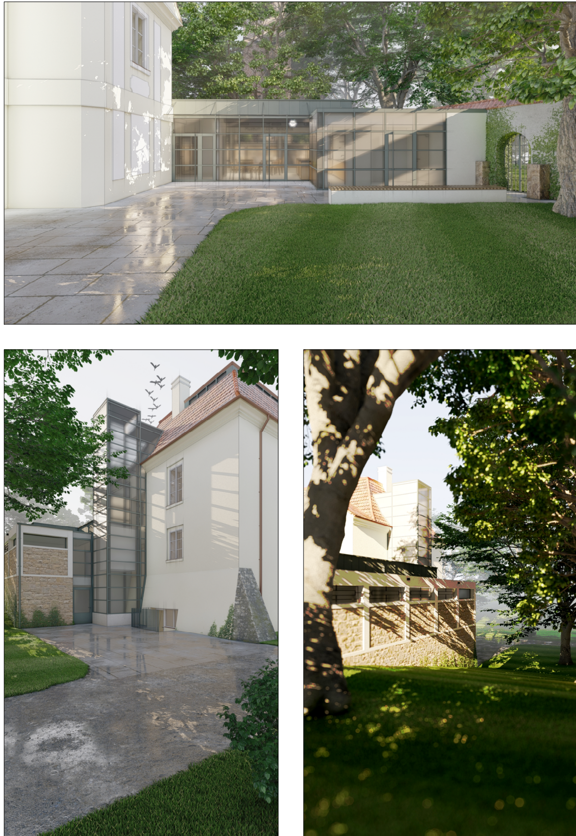
LEGENDA POVRCHŮ A MATERIÁLŮ: