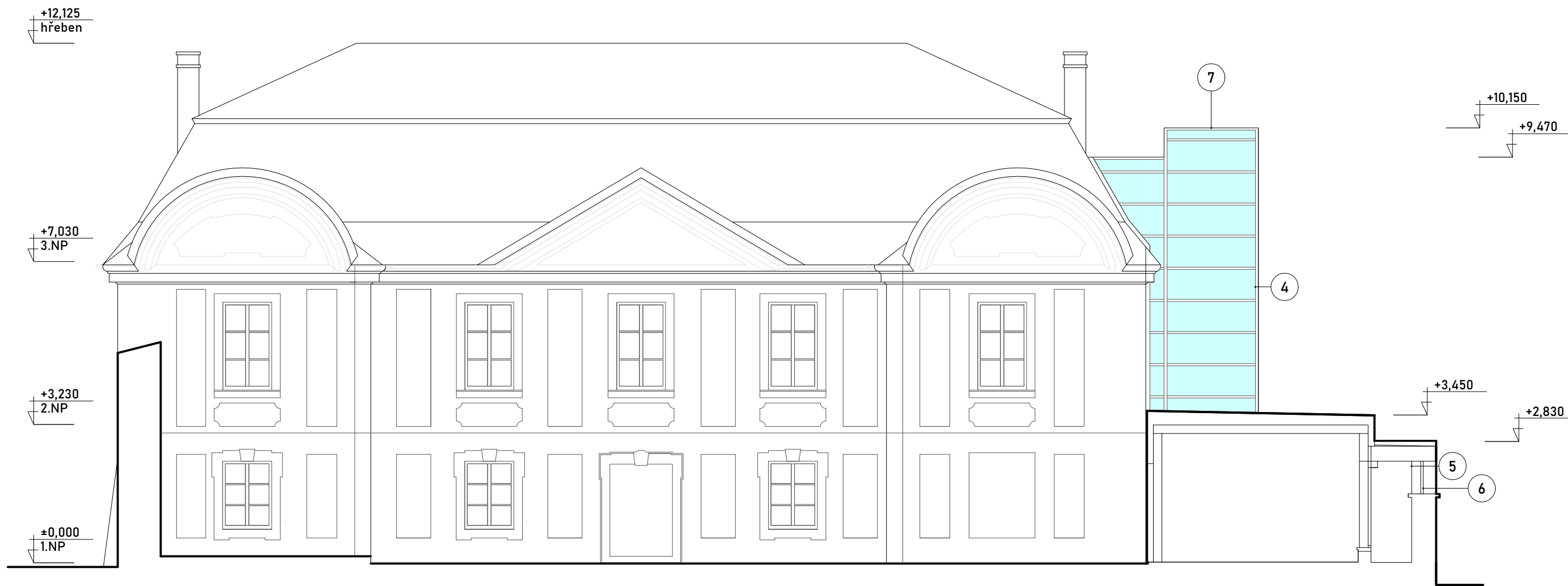
POHLED SEVERNÍ - M 1:100